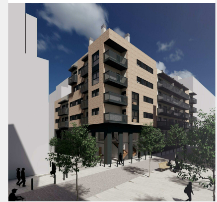
Baixos Sisena ESCALA B